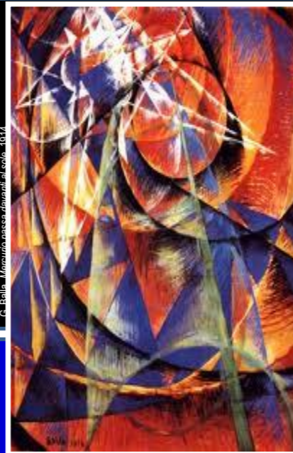
G. Bella - Maurizio nasce davanti al sole - 1914

Segreteria organizzativa Dipartimento di Giurisprudenza Università degli Studi di Roma Tor Vergata Via B. Alimena, 5 – 00173 Roma Tel.: 06. 7259. 2319 E-mail: convegno.sifd@gmail.com